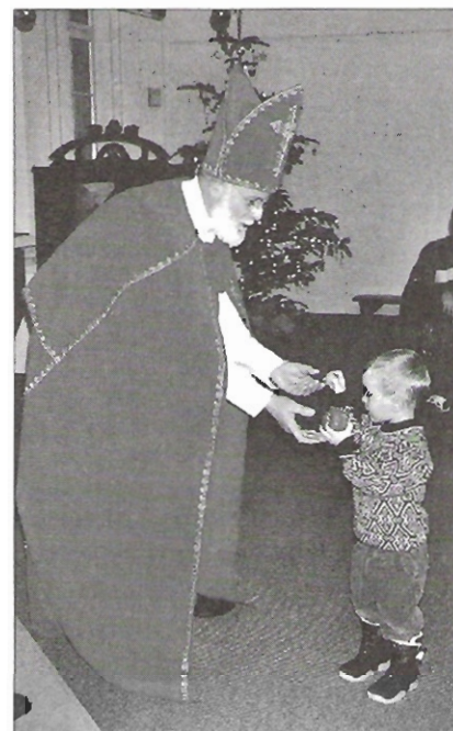
Un père Noël très attentif.

Avant de se quitter, Saint-Nicolas dont la générosité n'a pas de limite, distribua à chacun un délicieux bonhomme en pâte. Occasion de continuer le partage avec la famille que l'on allait rejoindre à Sainte-Croix, Vuiteboeuf, Baulmes, Champvent, Yverdon, Grandson ou Les Tuileries. Non sans avoir encore