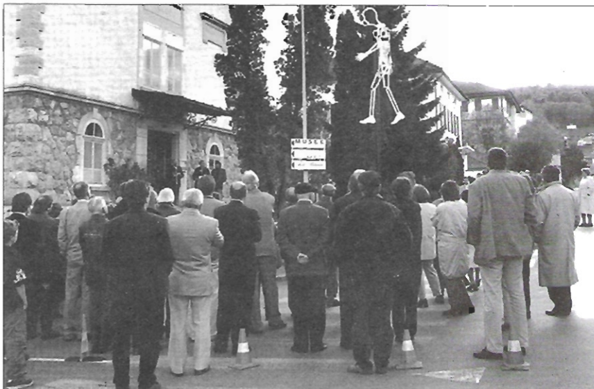
CL. GLAUSER - A

L'inauguration de L'homme qui marche de François Junod.